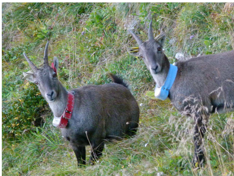
Princesse et Vénus Photo : PNRC – sept 2011

Retrouvez toutes les photos du bouquetin sur la galerie photo du site du Parc naturel régional de Chartreuse www.parc-chartreuse.net